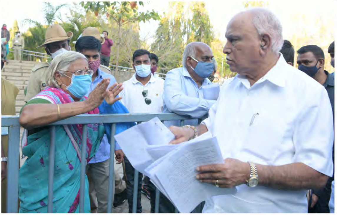
ಫೆಬ್ರವರಿ 13 ರಂದು ಮೈಸೂರು ಜಿಲ್ಲೆಯಲ್ಲಿ ವಿವಿಧ ಕಾರ್ಯಕ್ರಮದಲ್ಲಿ ಭಾಗವಹಿಸಿದ್ದ ಮುಖ್ಯಮಂತ್ರಿ ಬಿ.ಎಸ್.ಯಡಿಯೂರಪ್ಪ ಅವರು ಸಾರ್ವಜನಿಕರಿಂದ ಅಪವಾಲು ಸ್ವೀಕರಿಸಿ ಕುಂದುಕೊರತೆಯನ್ನು ಆಲಿಸುತ್ತಿರುವುದು.