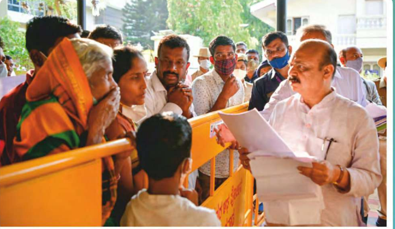
ಮುಖ್ಯಮಂತ್ರಿ ಬಸವರಾಜ ಎಸ್ ಬೊಮ್ಮಾಯಿ ಅವರು ತಮ್ಮ ನಿವಾಸದ ಬಳಿ ಸಾರ್ವಜನಿಕರಿಂದ ಕುಂದುಕೊರತೆಗಳ ಅಹವಾಲುಗಳನ್ನು ಸ್ವೀಕರಿಸುತ್ತಿರುವುದು.