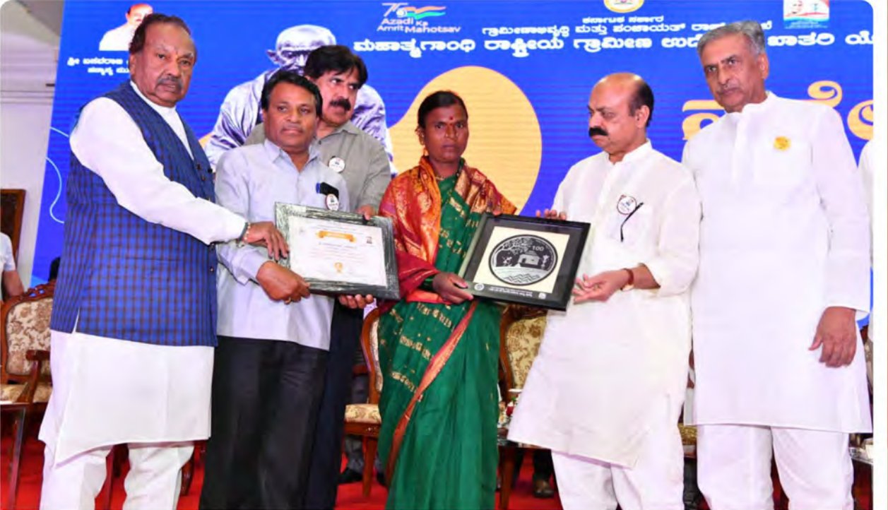
ಮಾರ್ಚ್ 14 ರಂದು ಬೆಂಗಳೂರಿನಲ್ಲಿ ನರೆಗಾ ಹಬ್ಬ 2022 ಕಾರ್ಯಕ್ರಮವನ್ನು ಉದ್ಘಾಟಿಸಿ, ಅಧಿಕಾರಿಗಳಿಗೆ ನರೆಗಾ ವಾರ್ಷಿಕ ಪ್ರಶಸ್ತಿಯನ್ನು ಪ್ರದಾನ ಮಾಡಿದ ಸಂದರ್ಭ.