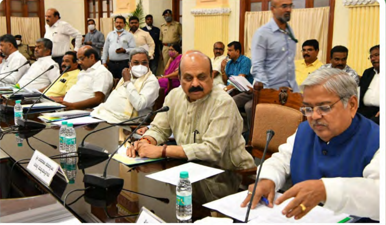
ಮಾರ್ಚ್ 18 ರಂದು ಮುಖ್ಯಮಂತ್ರಿ ಅವರ ಅಧ್ಯಕ್ಷತೆಯಲ್ಲಿ ಅಂತರ ರಾಜ್ಯ ಜಲ ವಿವಾದಗಳ ಕುರಿತು ವಿಧಾನ ಮಂಡಲ ಉಭಯ ಸದನಗಳ ನಾಯಕರ ಸಭೆ ನಡೆಸಿದ ಸಂದರ್ಭ.