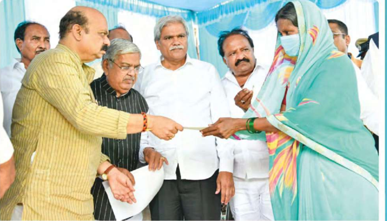
ಮಾರ್ಚ್ 19 ರಂದು ಶಹಾಪೂರ ತಾಲ್ಲೂಕಿನ ದೋರನಹಳ್ಳಿ ಗ್ರಾಮದಲ್ಲಿ ಗ್ಯಾಸ್ ಸಿಲಿಂಡರ್ ಸ್ಟೋಟದಿಂದ ಮೃತಪಟ್ಟ 15 ಜನರ ವಾರಸುದಾರರಿಗೆ ಮುಖ್ಯಮಂತ್ರಿಗಳ ಪರಿಹಾರ ನಿಧಿಯಿಂದ ಚೆಕ್ ವಿತರಿಸಿದ ಸಂದರ್ಭ.