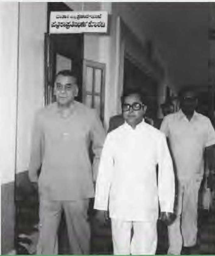
ಬಹಳ ವರ್ಷಗಳ ಹಿಂದೆ ವಿಧಾನಸೌಧಕ್ಕೆ ಬೇಟಿ ನೀಡಿದ ಸಂದರ್ಭ

ಸ್ನೇಹಿತರು ಮತ್ತು ಬಂಧುಗಳಿಂದ 'ಪ್ರಣವ್‌ದಾ' ಎಂದೇ ಕರೆಸಿಕೊಳ್ಳುತ್ತಿದ್ದ ಡಾ. ಪ್ರಣವ್ ಮುಖರ್ಜಿ ಅವರು ಸುಮಾರು ಐದು ದಶಕಗಳ ಕಾಲ ವೃತ್ತಿ ರಾಜಕಾರಣದಲ್ಲಿ ಹಂತ ಹಂತವಾಗಿ ಬೆಳೆದು ಅಂತಿಮವಾಗಿ ಆಡಳಿತ ವ್ಯವಸ್ಥೆಯ ಪರಮ ಅಧಿಕಾರದ 'ರಾಷ್ಟ್ರಪತಿ' ಹುದ್ದೆಗೆ ಏರಿತರಿದರು. ಪಶ್ಚಿಮ ಬಂಗಾಳದ ಬೀರ್‌ಭೂಮ್ ಜಿಲ್ಲೆಯ ಹಳ್ಳಿಯೊಂದರ ಸಾಮಾನ್ಯ ಕುಟುಂಬದಲ್ಲಿ ಜನಿಸಿ, ವಿದ್ವತ್ತಿನ ಮನ್ನಣೆ ಪಡೆದು, ರಾಜಕೀಯ ರಂಗ ಪ್ರವೇಶಿಸಿ ಅನೇಕ ಪ್ರಭಾವಿ ಹುದ್ದೆಗಳನ್ನು ನಿಭಾಯಿಸಿದವರು. ಅವರ ನಿರಂತರ ಸೇವೆಯನ್ನು ಪರಿಗಣಿಸಿ ಕೇಂದ್ರ ಸರ್ಕಾರವು ನಾಗರಿಕ ಪ್ರಶಸ್ತಿಯ ಅತ್ಯುನ್ನತ ಗೌರವವಾದ 'ಭಾರತ ರತ್ನ'ವನ್ನು ನೀಡಿ ಪುರಸ್ಕರಿಸಿತು.