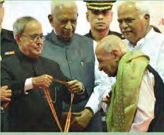
ಮೈಸೂರು ವಿಶ್ವವಿದ್ಯಾಲಯದ ತತ್ವಮಾನೋತ್ಪನ್ನ ಸಮಾರಂಭದಲ್ಲಿ ನಿಘಂಟು ತಜ್ಞ ಪ್ರೊ.ಬಿ.ವೆಂಕಟಸುಬ್ಬಯ್ಯ ಅವರನ್ನು ಸನ್ಮಾನಿಸುತ್ತಿರುವುದು.