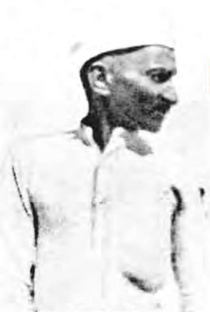
1920ರಲ್ಲಿ ಗಾಂಧೀಜಿ (ಅಸಹಕಾರ ಚಳವಳಿಯ ಆರಂಭಿಕ ಅವಧಿಯಲ್ಲಿ)