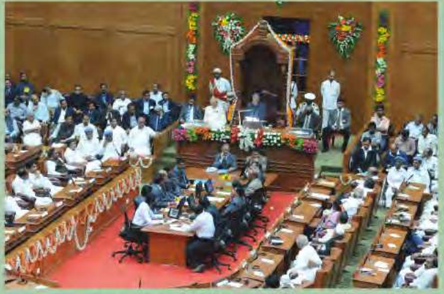
ಬೆಳಗಾವಿಯಲ್ಲಿ ಜರುಗಿದ ಮೊದಲ ಬಂಟಿ ಅಧಿವೇಶನವನ್ನು ಉದ್ದೇಶಿಸಿ ಭಾಷಣ ಮಾಡುತ್ತಿರುವ ಸಂದರ್ಭ.

ಭಾರತ ಸರ್ಕಾರವು ಅವರು ರಾಜನೀತಿ ಮತ್ತು ಆರ್ಥಿಕ ಕ್ಷೇತ್ರಕ್ಕೆ ಸಲ್ಲಿಸಿದ ಅನುಪಮ ಸೇವೆಯನ್ನು ಪರಿಗಣಿಸಿ ಎರಡನೇ ಅತ್ಯುನ್ನತ ನಾಗರಿಕ ಪ್ರಶಸ್ತಿಯಾದ ಪದ್ಮವಿಭೂಷಣ (2008) ಹಾಗೂ ಮೊದಲನೇ ಅತ್ಯುನ್ನತ ನಾಗರಿಕ ಪ್ರಶಸ್ತಿಯಾದ ಭಾರತರತ್ನ (2019) ನೀಡಿ ಪುರಸ್ಕರಿಸಿದೆ.