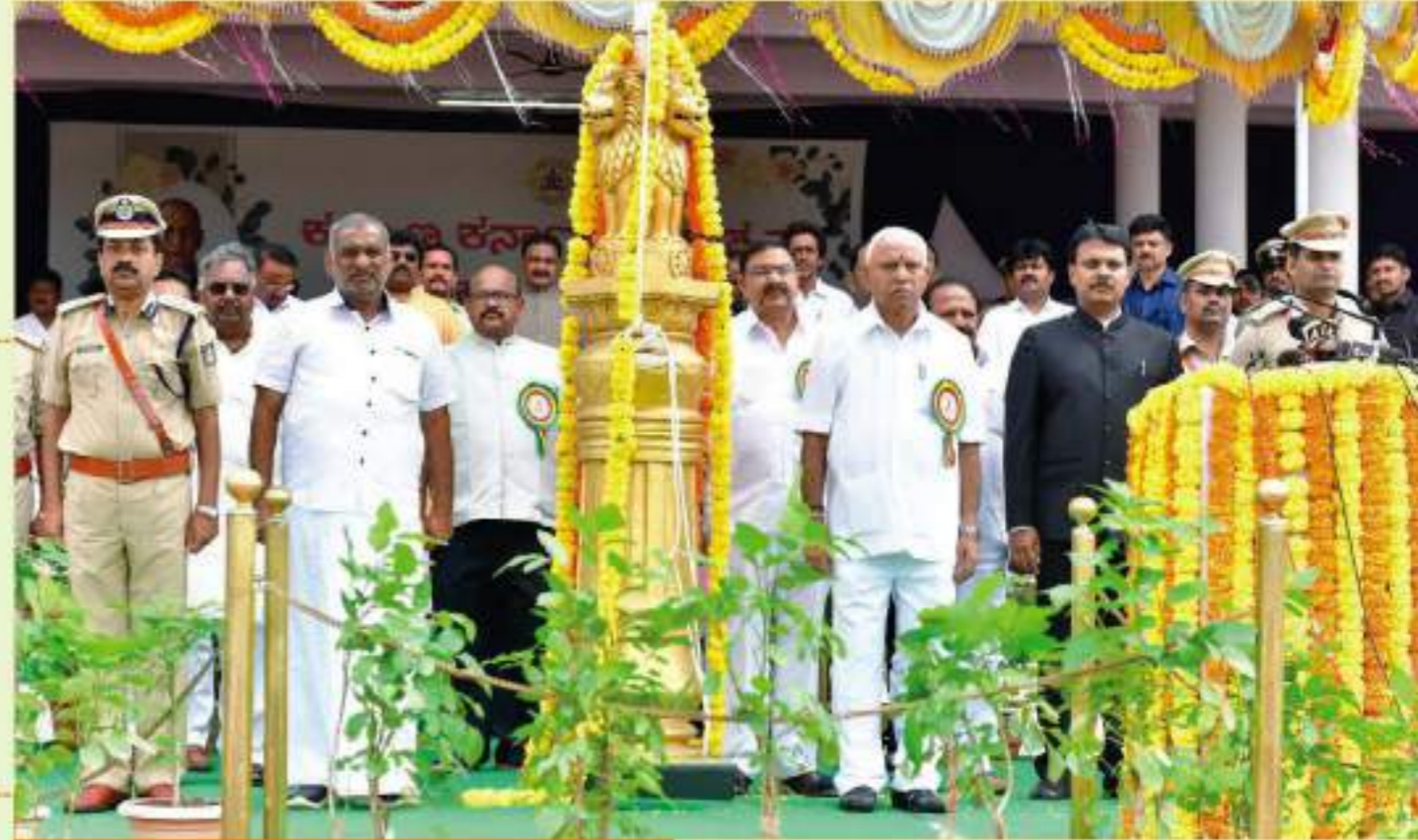
ಮುಖ್ಯಮಂತ್ರಿಗಳು ಮಹಾರಾಷ್ಟ್ರಕ್ಕೆ ಭೇಟಿ ನೀಡಿದ ಕುರಿತು ಪ್ರಕಟಿಸಲಾಗಿರುವ ಲೇಖನವು ಉತ್ತರ ಕರ್ನಾಟಕದ ಜನಶಕ್ತಿ ಚಳುವಳಿಗೆ ನ್ಯಾಯ ದೊರೆತಿದೆ ಎಂಬುದನ್ನು ವಿಚಿತವಡಿಸಿದೆ.

'ವಾರ್ತಾ ಜನಪದ' ಮಾಸಿಕಕ್ಕೆ ಚಂದಾದಾರರಾಗುವವರು ರೂ. 25/- ಅನ್ನು ಕಡ್ಡಾಯವಾಗಿ "The Director, Department of Information & Public Relations" ಹೆಸರಿನಲ್ಲಿ ಡಿ.ಡಿ. ಮುಖಾಂತರವೇ ಕಳುಹಿಸಬೇಕು. ಪನಿ ಆಡರ್ ಮೂಲಕ ಹಣವನ್ನು ಸ್ವೀಕರಿಸುವುದಿಲ್ಲ.