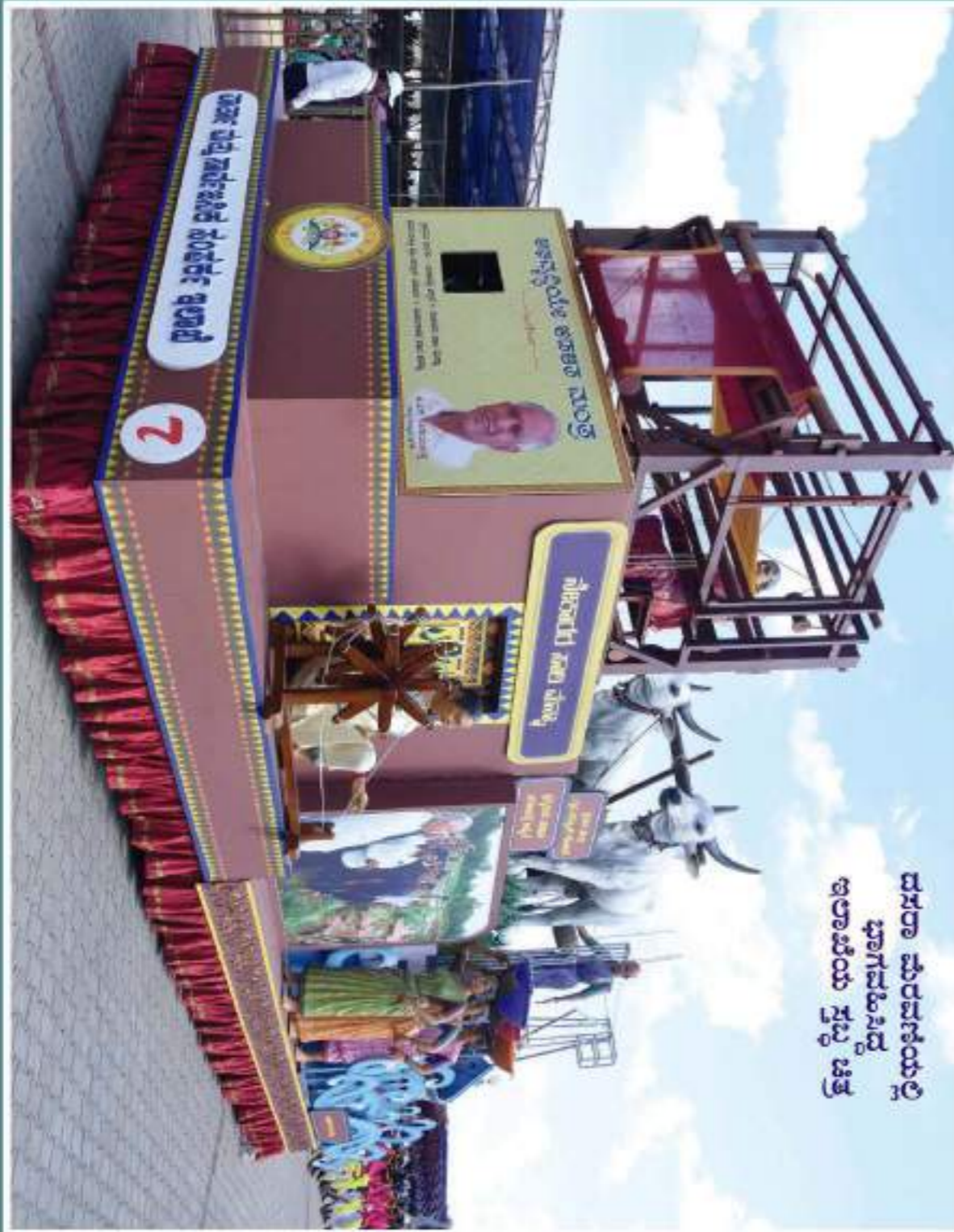
ದಸರಾ ಮೆರವಣಿಯಲ್ಲಿ ಶಿವರಾಜ್ ಮಠದ ಶಿವರಾಜ್ ಮಠದ ಶಿವರಾಜ್ ಮಠದ