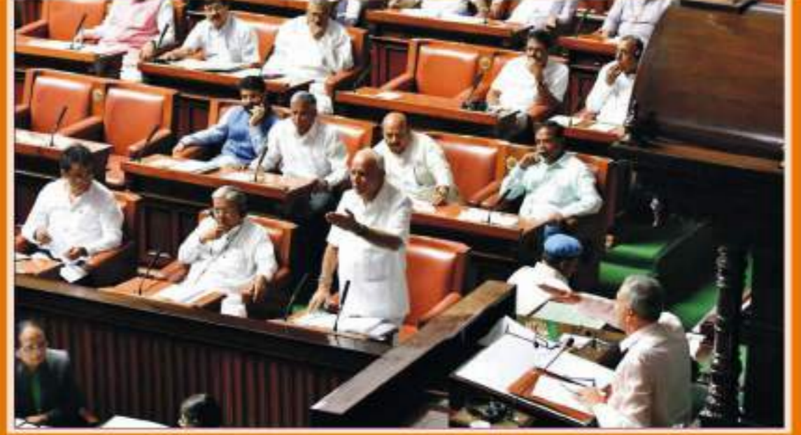
ಅಕ್ಟೋಬರ್ 11 ರಂದು ವಿಧಾನಸಭೆಯಲ್ಲಿ ಪ್ರವಾಹ ಪರಿಸ್ಥಿತಿ ಕುರಿತಂತೆ ನಡೆದ ಚರ್ಚೆಯ ಸಂದರ್ಭದಲ್ಲಿ ಮುಖ್ಯಮಂತ್ರಿ ಬಿ.ಎಸ್.ಯಡಿಯೂರಪ್ಪ ಅವರು ಉತ್ತರ ನೀಡುತ್ತಿರುವುದು.