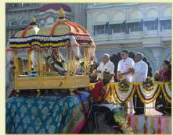
“ಯುಗ ಯುಗಾದಿ ಕಳೆದರೂ ಯುಗಾದಿ ಮರಳಿ ಬರುತ್ತಿದೆ” ಎಂಬ ಕವಿಮಾತೆಯಂತೆ ಪ್ರತಿವರ್ಷವೂ ದಸರ ಬರುತ್ತದೆ. ಮೈಸೂರು ದಸರಾ ವಿಶ್ವವಿಖ್ಯಾತ. ಇದು ರಾಜಮಹಾರಾಜರ ಕಾಲದಿಂದಲೂ ಅಂದರೆ ಸುಮಾರು 409 ವರ್ಷಗಳಿಂದಲೂ ವೈಭವದಿಂದ ನಡೆದುಕೊಂಡು ಬರುತ್ತಿದೆ. ಪ್ರತಿವರ್ಷ ದಸರ ಬರುತ್ತಿದ್ದರೂ ಆಯಾ ಕಾಲಕ್ಕೆ ತಕ್ಕಂತೆ ಹೊಸ ಹೊಸ

Telegram Channel- ಅಂತಿ ಪ್ರಸನ್ನಕುಮಾರ್ @spardakarnataka