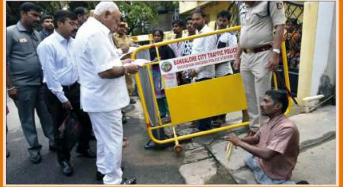
ಮುಖ್ಯಮಂತ್ರಿ ಬಿ.ಎಸ್.ಯಡಿಯೂರಪ್ಪ ಅವರು ಭವಳಗಿರಿಯ ತಮ್ಮ ನಿವಾಸದಲ್ಲಿ ಸಾರ್ವಜನಿಕರಿಂದ ಅಹವಾಲು ಸ್ವೀಕರಿಸಿದ ಸಂದರ್ಭದಲ್ಲಿ ವಿಶೇಷಚೇತನ ಯುವಕರೊಬ್ಬರ ಅಹವಾಲನ್ನು ಸ್ವೀಕರಿಸಿ, ಅವರ ಸಮಸ್ಯೆಯನ್ನು ಆಲಿಸುತ್ತಿರುವುದು.