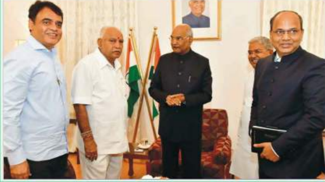
ಅಕ್ಟೋಬರ್ 12 ರಂದು ಮುಖ್ಯಮಂತ್ರಿ ಬಿ.ಎಸ್. ಯಡಿಯೂರಪ್ಪ ಅವರು ರಾಜಭವನದಲ್ಲಿ ರಾಷ್ಟ್ರಪತಿ ರಾಮನಾಥ್ ಕೋವಿಂದ್ ಅವರನ್ನು ಭೇಟಿ ಮಾಡಿದ ಸಂದರ್ಭ. ಈ ಸಂದರ್ಭದಲ್ಲಿ ಉಪ ಮುಖ್ಯಮಂತ್ರಿಗಳಾದ ಗೋವಿಂದ ಎಂ.ಕಾರಜೋಳ ಮತ್ತು ಡಾ.ಸಿ.ಎನ್. ಅಶ್ವತ್ಥ ನಾರಾಯಣ್ ಹಾಗೂ ಸರ್ಕಾರದ ಮುಖ್ಯ ಕಾರ್ಯದರ್ಶಿ ಟಿ.ಎಂ. ವಿಜಯಭಾಸ್ಕರ್ ಉಪಸ್ಥಿತರಿದ್ದರು.