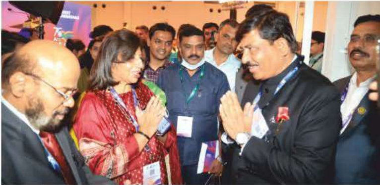
ಬಯೋಕಾನ್ ಅಧ್ಯಕ್ಷೆ ಕಿರಣ್ ಮಜುಂದಾರ್ ಶಾ ಅವರನ್ನು ಜಿಮ್-2022ಗೆ ಸ್ವಾಗತಿಸುತ್ತಿರುವ ಸಚಿವರು.

2021-2022ರ ಆರ್ಥಿಕ ವರ್ಷದ ಮೊದಲೆರಡು ತ್ರೈಮಾಸಿಕದಲ್ಲಿ ದೇಶದ ಒಟ್ಟು ವಿದೇಶಿ ನೇರ ಬಂಡವಾಳ ಹೂಡಿಕೆಯನ್ನು ಗಮನಿಸಿದಾಗ ಕರ್ನಾಟಕಕ್ಕೆ ಕ್ರಮವಾಗಿ ಶೇ.48 ಮತ್ತು ಶೇ.41ರಷ್ಟು ಬಂಡವಾಳದ ಹರಿವು ಬಂದಿರುವುದು ರಾಜ್ಯದ ಕೈಗಾರಿಕಾ ಕ್ಷೇತ್ರ ಸಾಗುತ್ತಿರುವ ದಾರಿಗೆ ಸ್ಪಷ್ಟ ದಿಕ್ಕೊಚ್ಚಿ. ಇಂತಹ ಬಂಡವಾಳ ಹೂಡಿಕೆ ಮಾಡುವ ಸಂದರ್ಭದಲ್ಲಿ ಯಾವ ವಿದೇಶಿ ಕಂಪನಿಯೂ ಕೂಡ ಕಣ್ಣುಚ್ಚಿ ದುಡ್ಡು ಸುರಿಯುವುದಿಲ್ಲ. ಮಾಹಿತಿ ತಂತ್ರಜ್ಞಾನ ಕ್ಷೇತ್ರದಲ್ಲಿ ಈಗಾಗಲೇ ಜಾಗತಿಕ ಮಟ್ಟದಲ್ಲಿ ಅದ್ವಿತೀಯ ಸಾಧನೆಯನ್ನು ಮಾಡಿರುವ ಬೆಂಗಳೂರಿನಲ್ಲಿ ಈಗಾಗಲೇ ಬೇರು ಬಿಟ್ಟಿರುವ ಸ್ಥಳೀಯ ಸಂಸ್ಥೆಗಳ ಒಟ್ಟಾರೆ ಕಾರ್ಯನಿರ್ವಹಣೆ, ಸ್ಥಳೀಯ ಸರ್ಕಾರದ ಹೂಡಿಕೆ ಸ್ನೇಹಿ ನೀತಿಗಳು, ಟೊಂಕಕಟ್ಟಿ ನಿಲ್ಲುವ ಅಧಿಕಾರಶಾಹಿ ಎಲ್ಲವನ್ನೂ ಅಳಿಯುವ ಕೆಲಸವನ್ನು ಈ ಕಂಪನಿಗಳು ಮಾಡಿಯೇ ಮಾಡಿರುತ್ತವೆ. ಕರ್ನಾಟಕದಲ್ಲಿ ಹತ್ತು ಹಲವು ವಲಯಗಳಲ್ಲಿ ಬೆಳೆದು ನಿಂತಿರುವ ಹಲವಾರು ಸಂಸ್ಥೆಗಳು ಹೂಡಿಕೆಯನ್ನು ಮಾಡುವ ವಿದೇಶಿ ಸಂಸ್ಥೆಗಳಿಗೆ ಕನ್ನಡಿಗಳಾಗಿವೆ. ಟೊಯೊಟಾ, ಬೋಯಿಂಗ್, ಇನ್ಫೋಸಿಸ್, ವಿಪ್ರೋದಂತಹ ಸಂಸ್ಥೆಗಳು ನಮ್ಮ ರಾಜ್ಯದ ಪಾಲಿಗೆ ಬ್ರಾಂಡ್ ಅಂಬಾಸಡರ್‌ಗಳಾಗಿವೆ. ಈ ರೀತಿಯ ಪೂರಕ ವಾತಾವರಣ ಇದ್ದ ಕಾರಣಕ್ಕೆ ಬಂಡವಾಳದ ಹರಿವು ಜಾಸ್ತಿಯಾಗಿದೆ ಎಂಬುದು ಸ್ಪಷ್ಟತರ್ಕ.