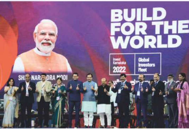
ಜಾಗತಿಕ ಹೂಡಿಕೆದಾರರ ಸಮಾವೇಶ-2022 ಉದ್ಘಾಟನೆ ಮಾಡಿದ ಸಂದರ್ಭ.