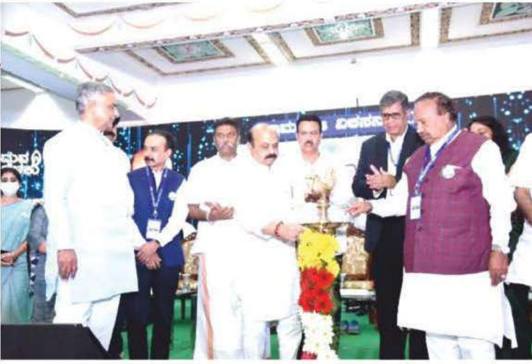
ಮುಖ್ಯಮಂತ್ರಿಗಳು ಹಾಗೂ ಗ್ರಾ.ಅ.ಆ.ಪಂ.ರಾಜ್ ಸಚಿವರಿಂದ ಗ್ರಾಮ ಡಿಜಿ ವಿಕಸನ 2022ರ ಉದ್ಘಾಟನೆ.

ಲಕ್ಷ ರೂ ವರೆಗೆ ಅನುದಾನ ಬಿಡುಗಡೆ ಮಾಡಲಾಗುತ್ತಿದೆ.