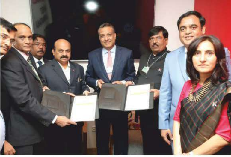
ರನ್ನೂ ಪವರ್ ಪ್ರೈಲಿಮಿಟೆಡ್ ಕಂಪನಿಯು ರಾಜ್ಯ ಸರ್ಕಾರದೊಂದಿಗೆ ಹೂಡಿಕೆ ಒಪ್ಪಂದಕ್ಕೆ ಸಹಿ ಮಾಡಿದ ಸಂದರ್ಭ.

ರಾಜ್ಯಗಳ ನಡುವೆ ಆರೋಗ್ಯ ಪೂರ್ಣವಾದ ಪೈಪೋಟಿ ಇರುತ್ತದೆ. 2022ರ ಆರ್ಥಿಕ ಸಾಲಿನಲ್ಲಿ ದೇಶದ ರಫ್ತಿಗೆ ರಾಜ್ಯ ಕೊಟ್ಟ ಕೊಡುಗೆ 23 ಬಿಲಿಯನ್ ಡಾಲರ್. ಇದು ಈವರೆಗಿನ ಬೃಹತ್ ಮೊತ್ತ ಎಂದು ದಾಖಲಾಗಿದೆ, ಮಾತ್ರವಲ್ಲ ಇಡೀ ದೇಶದಲ್ಲಿ ರಫ್ತು ಮಾಡುವ ರಾಜ್ಯಗಳಲ್ಲಿ ಮುನ್ನಡೆ ಸಾಧಿಸಿರುವುದು ನಾಲ್ಕು ರಾಜ್ಯಗಳು. ಅವುಗಳಲ್ಲಿ ನಮ್ಮ ರಾಜ್ಯವೂ ಒಂದು ಎಂಬ ಹೆಗ್ಗಳಿಕೆಗೆ ಕರ್ನಾಟಕ ಪಾತ್ರವಾಗಿದೆ.