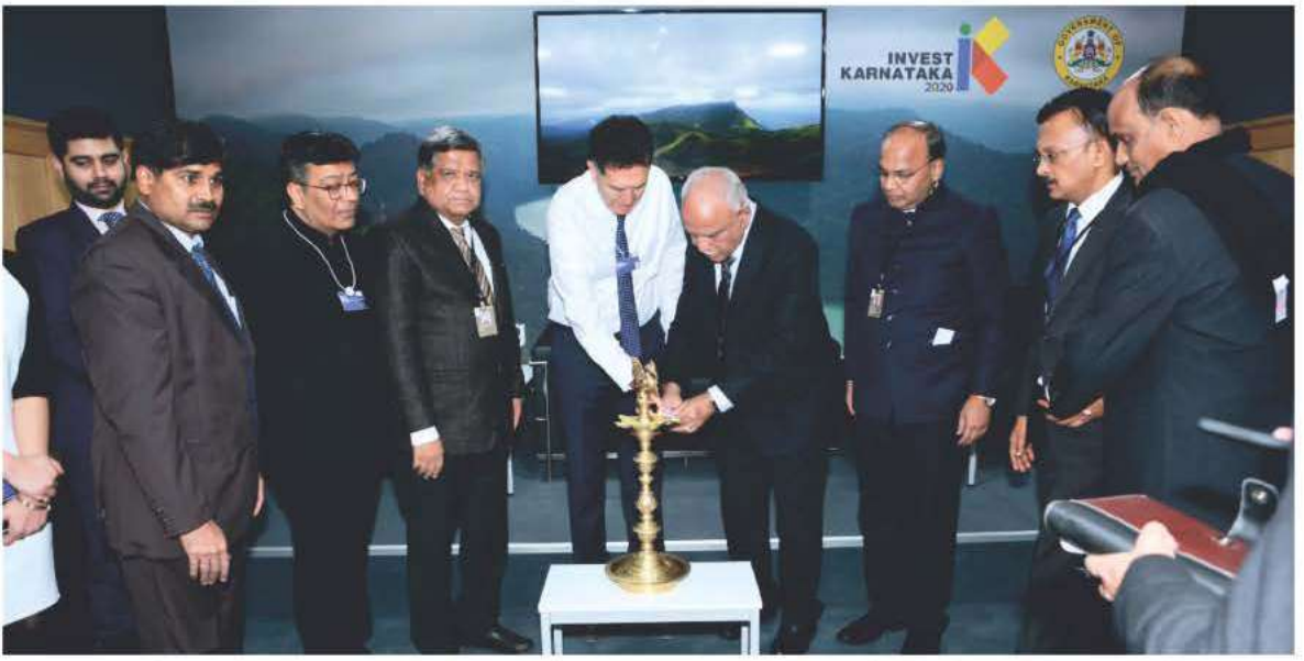
ಯಡಿಯೂರಪ್ಪ ಅವರು ಮುಖ್ಯಮಂತ್ರಿಗಳಾಗಿದ್ದಾಗ ದಾವೋಸ್ ನಲ್ಲಿ ಕರ್ನಾಟಕ-ಜಾಗತಿಕ ಹೂಡಿಕೆದಾರರ ಸಮಾವೇಶವನ್ನು ಉದ್ಘಾಟನೆ ಮಾಡಿದ ಸಂದರ್ಭ.