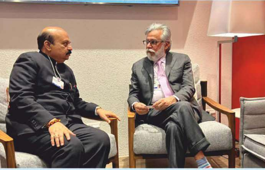
ಹೀರೋ ಮೋಟೋಕಾರ್ಪ್‌ನ ಅಧ್ಯಕ್ಷರು ಹಾಗೂ ಸಿಇಒ ಪವನ್ ಮುಂಜಲ್ ಅವರು ದಾವ್ನೋಸ್‌ನಲ್ಲಿ ಮುಖ್ಯಮಂತ್ರಿ ಅವರೊಂದಿಗೆ ರಾಜ್ಯದಲ್ಲಿನ ಹೂಡಿಕೆ ಅವಕಾಶಗಳ ಕುರಿತು ಚರ್ಚಿಸುತ್ತಿರುವುದು.

ಉದ್ಯೋಗಕ್ಕೆ ಹೆಚ್ಚಿನ ಪ್ರಾಶಸ್ತ್ಯವನ್ನು ನೀಡಿರುವ ಸರ್ಕಾರವು ಕಳೆದ ತಿಂಗಳು ಶಿಗ್ಗಾವಿಯಲ್ಲಿ ಟೆಕ್‌ಸ್ಟೈಲ್ ಪಾರ್ಕ್ ಸ್ಥಾಪನೆಗೆ ಆರು ತಿಂಗಳ ಹಿಂದೆ ಶಂಕುಸ್ಥಾಪನೆ ಮಾಡಿದ್ದು, ಇದರಿಂದ ಆ ಭಾಗದ ಸಾವಿರಾರು ಜನರಿಗೆ ಉದ್ಯೋಗ ದೊರಕಲಿದೆ.