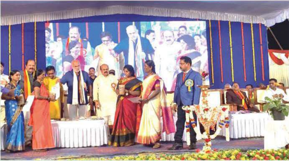
ಹಾವೇರಿಯಲ್ಲಿ ಸನ್ಮಾನ್ಯ ಮುಖ್ಯಮಂತ್ರಿಗಳಿಂದ ಜಿಎಲ್‌ಎಫ್ ಫಲಾನುಭವಿಗಳಿಗೆ ಸುಗಂಧ ವಿಸರ್ಜನೆ.

ಪರಿಸರಕ್ಕಾಗಿ ಜನರಿಂದಲೇ ಬೇಡಿಕೆ ಸೃಷ್ಟಿಸಲಾಗುತ್ತಿದ್ದು, ಗ್ರಾಮೀಣ ಪ್ರದೇಶದ ಎಲ್ಲಾ ಕುಟುಂಬಗಳೂ ಶೌಚಾಲಯ ಹೊಂದುವಂತೆ ಹಾಗೂ ಬಳಸುವಂತೆ ಉತ್ತೇಜಿಸುವ ಮೂಲಕ ಗ್ರಾಮೀಣ ಜನರ ಜೀವನಮಟ್ಟದಲ್ಲಿ ಸುಧಾರಣೆ ತರಲಾಗುತ್ತಿದೆ.