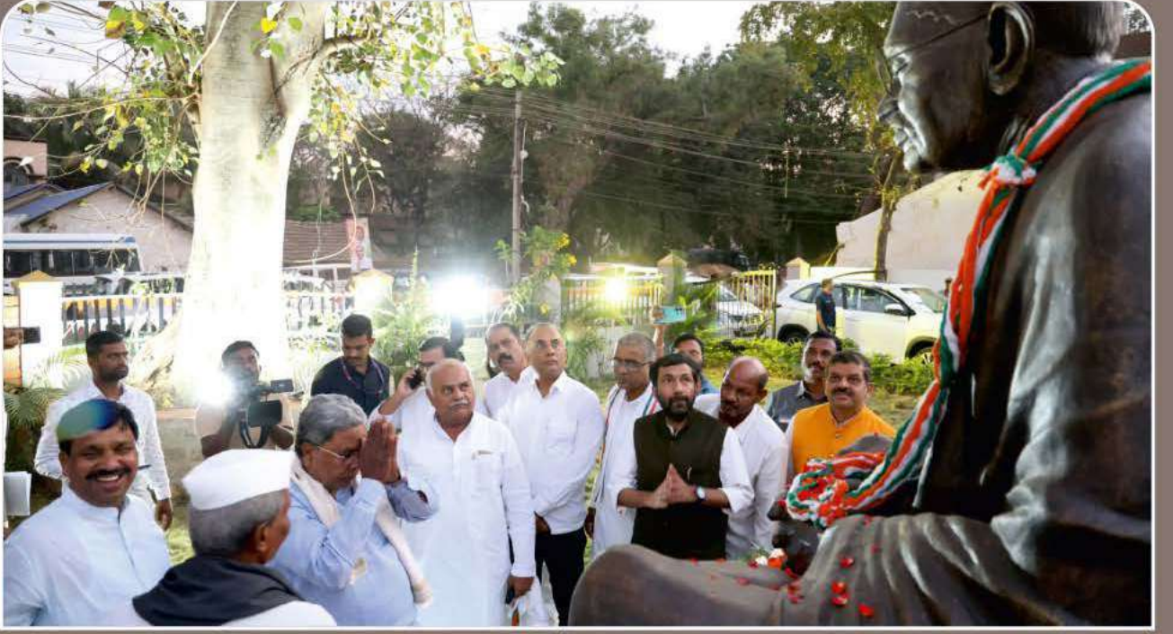
ಮುಖ್ಯಮಂತ್ರಿ ಸಿದ್ದರಾಮಯ್ಯ ಅವರು ಫೆಬ್ರವರಿ 18 ರಂದು ಹಾವೇರಿಯಲ್ಲಿ ನಿರ್ಮಾಣವಾಗಿರುವ ನೂತನ ಗಾಂಧಿ ಭವನವನ್ನು ಉದ್ಘಾಟಿಸಿದ ಸಂದರ್ಭ. ಈ ಸಂದರ್ಭದಲ್ಲಿ ಸಚಿವರಾದ ದಿನೇಶ್ ಗುಂಡೂರಾವ್, ಶಿವಾನಂದ ಪಾಟೀಲ್, ಮತ್ತಿತರ ಗಣ್ಯರು ಉಪಸ್ಥಿತರಿದ್ದಾರೆ.