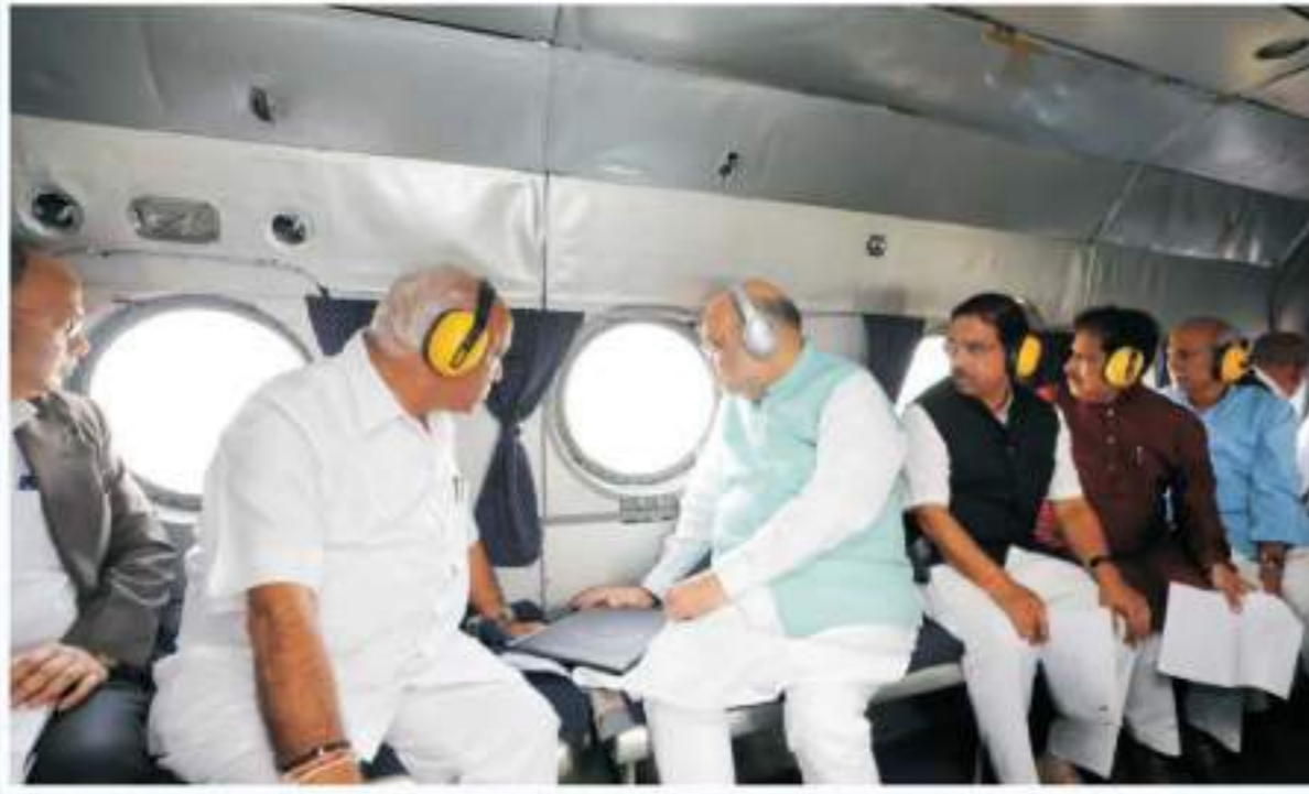
ಉತ್ತರ ಕರ್ನಾಟಕ ರಾಜ್ಯಗಳಲ್ಲಿ ಸಂಭವಿಸಿದ ಪ್ರವಾಹ ಸೀಡಿಕ ಪ್ರದೇಶಗಳ ವೀಕ್ಷಣೆಗಾಗಿ ಆಗಮಿಸಿದ್ದ ಕೇಂದ್ರ ಗೃಹ ಸಚಿವರಾದ ಅಮಿತ್ ಶಾ ಅವರು ಮುಖ್ಯಮಂತ್ರಿ ಬಿ.ಎಸ್.ಯಡಿಯೂರಪ್ಪ ಅವರೊಂದಿಗೆ ವೈಮಾನಿಕ ಸಮೀಕ್ಷೆ ನಡೆಸುತ್ತಿರುವುದು. ಈ ಸಂದರ್ಭದಲ್ಲಿ ಕೇಂದ್ರ ಸಚಿವರಾದ ಪ್ರವಾಲ್ ಜೋಶಿ, ಸುರೇಶ್ ಅಂಗಡಿ, ಸೇರಿದಂತೆ ಸ್ಥಳೀಯ ಶಾಸಕರುಗಳು ಉಪಸ್ಥಿತರಿದ್ದರು.