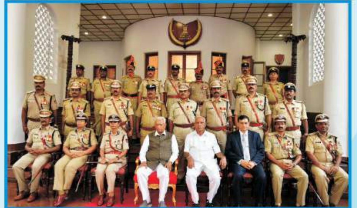
ರಾಜಭವನದಲ್ಲಿ 2018 ನೇ ಸಾಲಿನ ರಾಷ್ಟ್ರಮಟ್ಟದ ಪ್ರಶಸ್ತಿ ಪುರಸ್ಕೃತ ಪೊಲೀಸ್ ಅಧಿಕಾರಿಗಳಿಗೆ ರಾಜ್ಯಪಾಲರಾದ ವಜುಭಾಯಿ ವಾಲಾ ಅವರು ಮತ್ತು ಮುಖ್ಯಮಂತ್ರಿ ಬಿ.ಎಸ್.ಯಡಿಯೂರಪ್ಪ ಅವರು ಅಭಿನಂದನೆ ಸಲ್ಲಿಸಿದ ಸಂದರ್ಭದಲ್ಲಿ ತೆಗೆಸಿದ ಗ್ರೂಪ್ ಫೋಟೋ