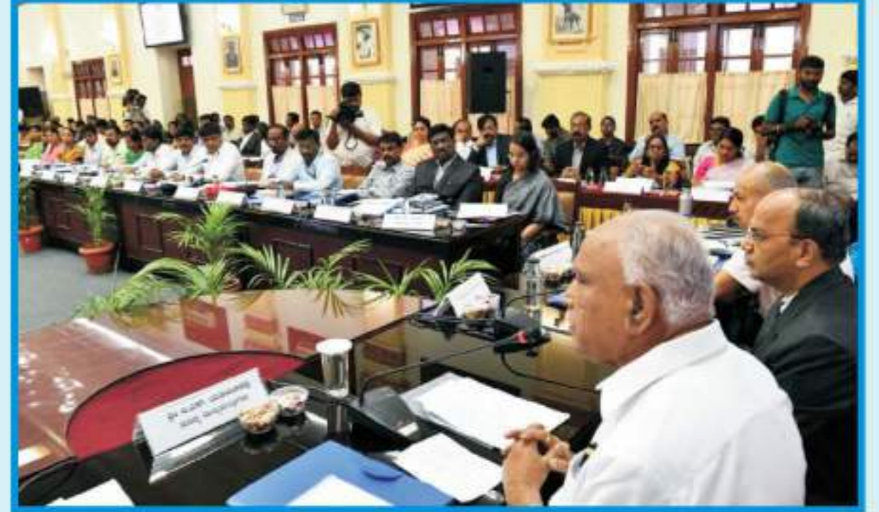
ಮುಖ್ಯಮಂತ್ರಿ ಬಿ.ಎಸ್. ಯಡಿಯೂರಪ್ಪ ಅವರು ವಿಧಾನಸೌಧದ ಸಮ್ಮೇಳನ ಸಭಾಂಗಣದಲ್ಲಿ ಆಗಸ್ಟ್ 2 ರಂದು ಜಿಲ್ಲಾಧಿಕಾರಿಗಳು ಮತ್ತು ಜಿಲ್ಲಾ ಪಂಚಾಯತ್ ಮುಖ್ಯ ಕಾರ್ಯನಿರ್ವಾಹಕಾಧಿಕಾರಿಗಳ ಸಭೆ ನಡೆಸಿದರು. ಸರ್ಕಾರದ ಮುಖ್ಯ ಕಾರ್ಯದರ್ಶಿಗಳಾದ ಟಿ.ಎಂ. ವಿಜಯಭಾಸ್ಕರ್ ಅವರು ಸೇರಿದಂತೆ ಹಿರಿಯ ಅಧಿಕಾರಿಗಳು ಪಾಲ್ಗೊಂಡಿದ್ದರು.