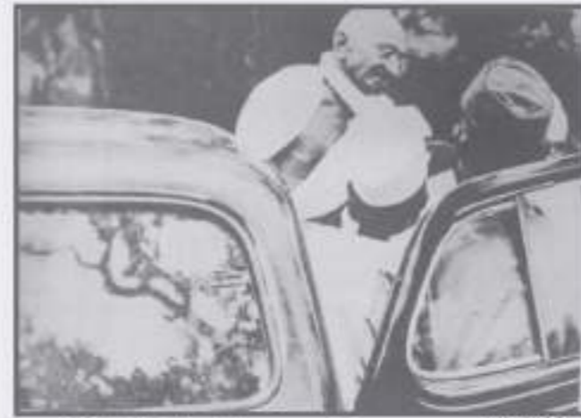
1934 ಜನವರಿ 4ರಂದು ಮಹಾತ್ಮ ಗಾಂಧೀಜಿ ದೊಡ್ಡಬಳ್ಳಾಪುರಕ್ಕೆ ಆಗಮಿಸಿದ ಸಂದರ್ಭದ ಚಿತ್ರ