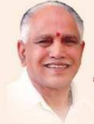
ಬಿ. ಎಸ್. ಯಡಿಯೂರಪ್ಪ ಮುಖ್ಯಮಂತ್ರಿಗಳು