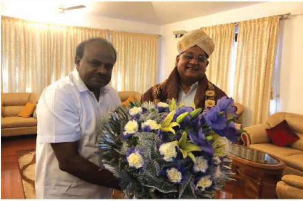
ರಾಜ್ಯ ಹೈಕೋರ್ಟ್‌ನ ಮುಖ್ಯ ನ್ಯಾಯಾಧಿಕಾರಿಗಳಾದ ದಿನೇಶ್ ಮಹೇಶ್ವರಿ ಅವರು ಸುಪ್ರೀಂಕೋರ್ಟ್‌ನ ನ್ಯಾಯಾಧಿಕಾರಿಗಳಾಗಿ ಪದೋನ್ನತಿ ಹೊಂದಿದ ಹಿನ್ನೆಲೆಯಲ್ಲಿ ಮುಖ್ಯಮಂತ್ರಿ ಹೆಚ್.ಡಿ. ಕುಮಾರಸ್ವಾಮಿ ಅವರು ಅವರನ್ನು ಅಭಿನಂದಿಸಿದರು