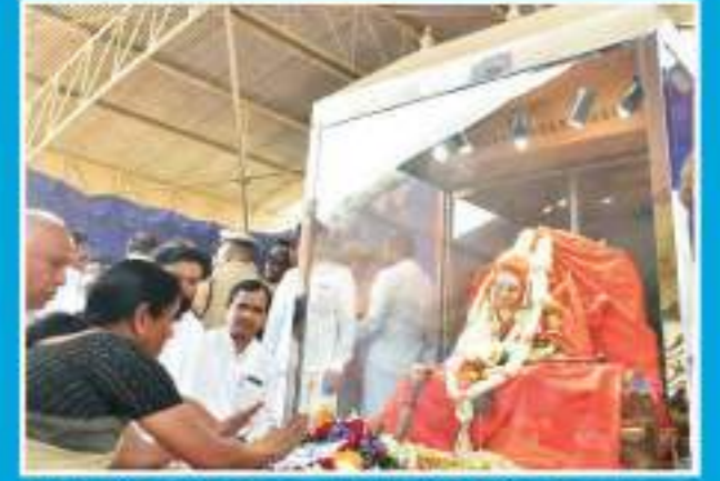
ಶ್ರೀಗಳ ಶುಭ ಸಮನ ಸದ್ವಿಲಾಸಸ್ವಾಮೀಜಿಯ ಕೀರ್ತಿ ಸಚಿವರ ವಿಮರ್ಶಣಾ ಸಭೆಯಲ್ಲಿ