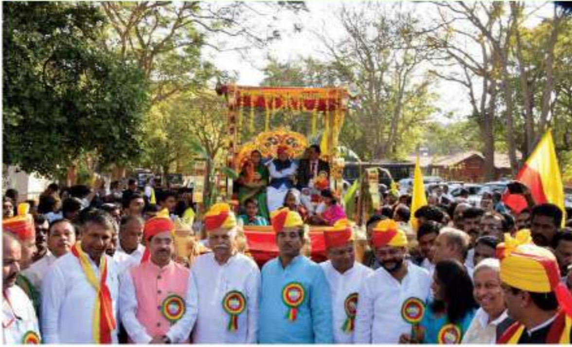
ರಾಷ್ಟ್ರಕವಿ ಕುವೆಂಪು ಅವರ ಅಧ್ಯಕ್ಷತೆಯಲ್ಲಿ ಧಾರವಾಡದಲ್ಲಿ ಜರುಗಿದ ಕನ್ನಡ ಸಾಹಿತ್ಯ ಸಮ್ಮೇಳನದಲ್ಲಿ ನಾನು ಸಂಘಟಕನಾಗಿ ತೊಡಗಿಸಿಕೊಂಡಿದ್ದೆ. ಇಂದು ಇದೇ ನೆಲದಲ್ಲಿ ನಾನು ಸಮ್ಮೇಳನಾಧ್ಯಕ್ಷನಾಗಿ ಗೌರವ ಸ್ವೀಕರಿಸುತ್ತಿರುವುದು ನನ್ನ ಸೌಭಾಗ್ಯ, ಸುದೈವ ಮತ್ತು ನನ್ನ ಪುಣ್ಯ. -ಡಾ.ಚಂದ್ರಶೇಖರ ಕಂಬಾರ, ಸಮ್ಮೇಳನದ ಸರ್ವಾಧ್ಯಕ್ಷರು

ಗಂಗೂಬಾಯಿ ಹಾನಗಲ್, ಭೀಮಸೇನ್ ಜೋಶಿ ಸಂಗೀತ ಸುಧೆ ಹರಿಸಿದ ಬೀಡು. ಗದಗನ ಪಂಚಾಕ್ಷರಿ ಗವಾಯಿ ಅವರು ಸಂಗೀತದಲ್ಲಿ ಪರಿಣತಿ ಹೊಂದಿದ್ದು ಇಲ್ಲಿಯೇ. ಟ್ರೇನಿಂಗ್ ಶಾಲೇಬು, ಬಾಸೆಲ್ ಮಿಶನ್, ಕರ್ನಾಟಕ ವಿದ್ಯಾವರ್ಧಕ ಸಂಘ, ಕರ್ನಾಟಕ ವಿಶ್ವವಿದ್ಯಾಲಯ, ಆಕಾಶವಾಹಿನಿಗಳ ಆಪೂರ್ವ ಇತಿಹಾಸ, ಹೀಗೆ ಹಲವಾರು ವಿಶೇಷತೆಗೆ ಹೆಸರಾದ ಧಾರವಾಡದಲ್ಲಿ 84ನೇ ಅಖಿಲ ಭಾರತ ಕನ್ನಡ ಸಾಹಿತ್ಯ ಸಮ್ಮೇಳನ ನಿಗದಿಯಾದಾಗ ನಾಡ ಜನರಲ್ಲ ಧಾರವಾಡದ ಕಡೆಗೆ ಮತ್ತೊಮ್ಮೆ ನೋಡುವಂತಾಯಿತು. ಸಮ್ಮೇಳನದ ಬಗ್ಗೆ ಜನರಲ್ಲಿ ಕುತೂಹಲವಿತ್ತು. ಅಂತೆಯೇ ಧಾರವಾಡ ಜನರು ಪ್ರೀತಿ, ವಿಶ್ವಾಸ ಸಂಯಮದಿಂದ ಎಲ್ಲಾ ವ್ಯವಸ್ಥೆ ಮಾಡಿದ ಹಿನ್ನೆಲೆಯಲ್ಲಿ ಸಮ್ಮೇಳನವು ಮೂರು ದಿನಗಳ ಕಾಲ ನಡೆದು ಯಶಸ್ವಿ ಕಂಡಿತು. ಶಾಂತಿಪ್ರಿಯ ಧಾರವಾಡ ಸದಾ ಸಂಸ್ಕೃತರ ನಾಡು ಎಂಬುದು ಮತ್ತೊಮ್ಮೆ ಸಾಬೀತಾಯಿತು. ಧಾರವಾಡದಲ್ಲಿ ಇದುವರೆಗೆ 5 ಸಮ್ಮೇಳನಗಳು ನಡೆದಿವೆ. ಧಾರವಾಡದ ಆರ್.ಎಲ್.ಎಸ್. ಮೈದಾನದಲ್ಲಿ 1957ರ ಮೇ 7, 8 ಮತ್ತು 9 ರಂದು ಇದ್ದ ಸಂತಸ, ಸಂಭ್ರಮವು ಈ ಬಾರಿಯೂ