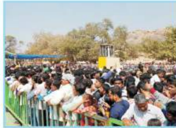
ಅಂಕಿತವು ದರ್ಶನಕ್ಕೆ ಕಾಯುತ್ತಿರುವ ಭಕ್ತವೃಂದ