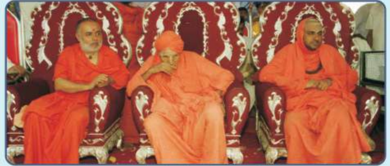
ಸ್ವಾಮೀಜಿ ಅವರೊಂದಿಗೆ ಅಧಿಪತಿಗಳಾಗಿಯೇ ಬಾಲಗಂಗಾಧರನಾಥ ಸ್ವಾಮೀಜಿ ಮತ್ತು ಸುತೂರಿನ ಶಿವರಾತ್ರಿ ದೇಶಿಕೇಂದ್ರ ಸ್ವಾಮೀಜಿ ಅವರು ಕಾರ್ಯಕ್ರಮವೊಂದರಲ್ಲಿ ಒಟ್ಟಾಗಿ ಛಾಯಾಯಾಗಿರುವ ಸಂದರ್ಭ.