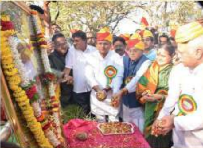
ಧರಗೆ ದೊಡ್ಡವಳಾದ ಸಾವಿರದ ಪರಣವು ಕನ್ನಡದ ತಾಯೀ ಎಂಬ ಕವನದ ಮೂಲಕ ಅಕ್ಷರ ಜಾತಿಯನ್ನು ಉದ್ಘಾಟಿಸುವ ಅವಕಾಶ ತಮ್ಮ ಪಾಲಿನ ಸುಕೃತ. ನಾಡಿನ ನೆಲ, ಜಲ, ಭಾಷೆ, ಸಂಸ್ಕೃತಿ ರಕ್ತನೆಯು ನಮ್ಮ ಸರ್ಕಾರದ ಆದ್ಯತೆಯಾಗಿದೆ. ರಾಷ್ಟ್ರಕವಿ ಕುವೆಂಪು ಅವರು ಹೇಳಿದಂತೆ ಕನ್ನಡಕ್ಕಾಗಿ ಕೈ ಎತ್ತು ನಿನ್ನ ಕೈ ಕಲ್ಪವೃಕ್ಷವಾಗುತ್ತದೆ ಎಂಬ ಈ ಮಾತಿನಲ್ಲಿ ನಂಬಿಕೆಯಿಟ್ಟು ಕನ್ನಡದ ಕಂಚಿತ್ ಸೇವೆ ಮಾಡುವ ಭಾಗ್ಯ ನನ್ನದಾಗಿರುವುದಕ್ಕೆ ಧನ್ಯನಾಗಿದ್ದೇನೆ. ಅಭಿವೃದ್ಧಿಗೆ ಪ್ರಾದೇಶಿಕ ತಾರತಮ್ಯವಿಲ್ಲದೆ ಅಖಿಲ ಕರ್ನಾಟಕ ಸಮೃದ್ಧವಾಗಬೇಕೆಂಬ ಅಚಲ ವಿಶ್ವಾಸದಿಂದ ಸರ್ಕಾರ ಆದ್ಯತೆ ಮೇಲೆ ಕಾರ್ಯ ನಿರ್ವಹಿಸುತ್ತಿದೆ. - ಹೆಚ್. ಡಿ. ಕುಮಾರಸ್ವಾಮಿ ಮಾನ್ಯ ಮುಖ್ಯಮಂತ್ರಿಗಳು

ಉತ್ಸವ', 'ಆಳಾಗಿ ದುಡಿ ಅರಸನಾಗಿ ಉಣ್ಣು' ಎನ್ನುವ ಘೋಷಣೆಗಳು ಮತ್ತು ನಾಣ್ಣುಡಿಗಳನ್ನು ಬರೆಯಲಾಗಿತ್ತು. ಅಖಿಲ ಭಾರತ ಕನ್ನಡ ಸಾಹಿತ್ಯ ಸಮ್ಮೇಳನದ ಮುಖ್ಯ ವೇದಿಕೆ ಇರುವ ಕೃಷಿ ವಿಶ್ವವಿದ್ಯಾಲಯದ ಆವರಣಕ್ಕೆ ಹೊರಡುವ ಅಂದಾಜು 4 ಕಿ.ಮೀ ರಸ್ತೆಯುದ್ದಕ್ಕೂ ಸಾಲುಸಾಲು ವಿದ್ಯುದೀಪ ಅಳವಡಿಸಿದ್ದರಿಂದ ಕಣ್ಣಿನ ಸೆಳೆಯುತ್ತಿತ್ತು. ಜೊತೆಗೆ ಕನ್ನಡ ಧ್ವಜಗಳನ್ನು ಕಟ್ಟಲಾಗಿತ್ತು. ಕೃಷಿ ವಿವಿ ರಸ್ತೆ, ಕರ್ನಾಟಕ ವಿಶ್ವವಿದ್ಯಾಲಯದ ರಸ್ತೆ, ಜಿಲ್ಲಾಧಿಕಾರಿ ಅವರ ಕಚೇರಿಗೆ ಹೊರಡುವ ರಸ್ತೆ ಸೇರಿದಂತೆ ನಗರದ ಬಹುತೇಕ ರಸ್ತೆಗಳ ಅಕ್ಕಪಕ್ಕದ ಕಾಂಪೌಂಡ್ ಗೋಡೆಯ ಮೇಲೆ ಬಡಿಸಿದ್ದ ಬಣ್ಣದ ಚಿತ್ರಾರ ಗಮನ ಸೆಳೆಯಿತು. ನಗರದ ವಿವಿಧ ವೃತ್ತಗಳಲ್ಲಿರುವ ಡಾ.ಬಿ.ಆರ್.ಅಂದೇಡ್ಕರ್, ಜಗಜೋತಿ ಬಸವೇಶ್ವರ ಇನ್ನೂ ಹಲವಾರು ಮಹಾತ್ಮರ ಮನ್ನಣೆಗಳಿಗೆ ಕನ್ನಡ ಧ್ವಜ, ಬಣ್ಣದ ಪರಿವರಿಗಳಿಂದ ಅಲಂಕಾರ ಮಾಡಲಾಗಿತ್ತು. ಕನ್ನಡ ನಾಡು-ನುಡಿ ಪ್ರತಿನಿಧಿಸುವ ಕರ್ನಾಟಕ