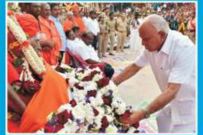
ಶ್ರೀಗಳ ಶುಭ ಸಮನ ಸದ್ವಿಲಾಸಸ್ವಾಮೀಜಿಯ ವಿರೋಧ ಪಕ್ಷದ ನಾಯಕ ಬಿ.ಎಸ್.ಯಡಿಯೂರಪ್ಪ