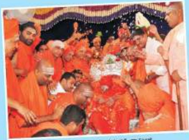
ಗುರುವಂದನಾ ಕಾರ್ಯಕ್ರಮದಲ್ಲಿ ಸ್ವಾಮೀಜಿ