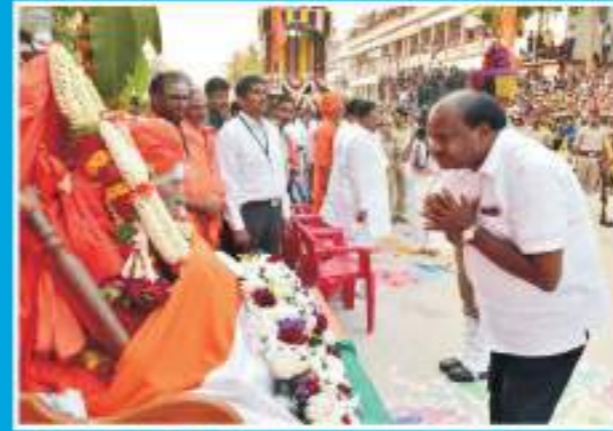
ಶ್ರೀಗಳ ಶುಭ ಸಮನ ಸದ್ವಿಲಾಸಸ್ವಾಮೀಜಿಯ ಮುಖ್ಯಮಂತ್ರಿ ಎಚ್.ಡಿ. ಕುಮಾರಸ್ವಾಮಿ.