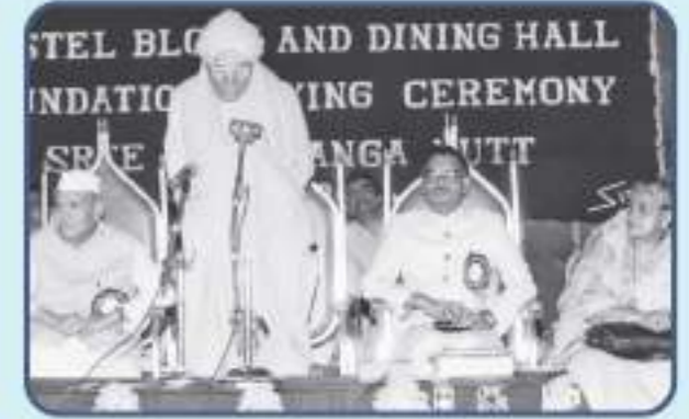
ಮಠದ ಸಮಾರಂಭವೊಂದಕ್ಕೆ ದಿವಂಗತ ಮಾಜಿ ರಾಷ್ಟ್ರಪತಿ ಶಂಕರ್ ದಯಾಳ್ ಶರ್ಮಾ ಹಾಗೂ ಅಂದಿನ ಕೇಂದ್ರ ಸಚಿವ ಶಿವರಾಜ್ ಪಾಟೀಲ್ ಅವರು ಆಗಮಿಸಿದ್ದ ಸಂದರ್ಭ.