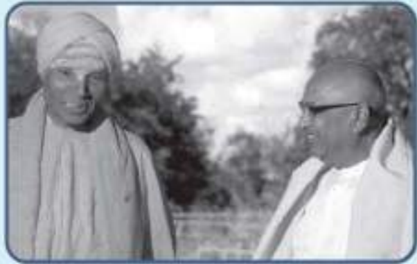
ದಿವಂಗತ ಮಾಜಿ ಮುಖ್ಯಮಂತ್ರಿ ಎಸ್. ನಿಜಲಿಂಗಪ್ಪ ಅವರು ಸ್ವಾಮೀಜಿ ಅವರನ್ನು ಭೇಟಿ ಮಾಡಿದ ಸಂದರ್ಭ.