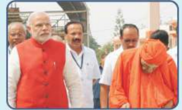
ಪ್ರಧಾನ ಮಂತ್ರಿ ನರೇಂದ್ರ ಮೋದಿ ಅವರು ಕೇಂದ್ರ ಸಚಿವರಾದ ಡಿ.ವಿ ಸದಾನಂದಗೌಡರೊಂದಿಗೆ ಮಠಕ್ಕೆ ಭೇಟಿ ನೀಡಿದ ಸಂದರ್ಭ.