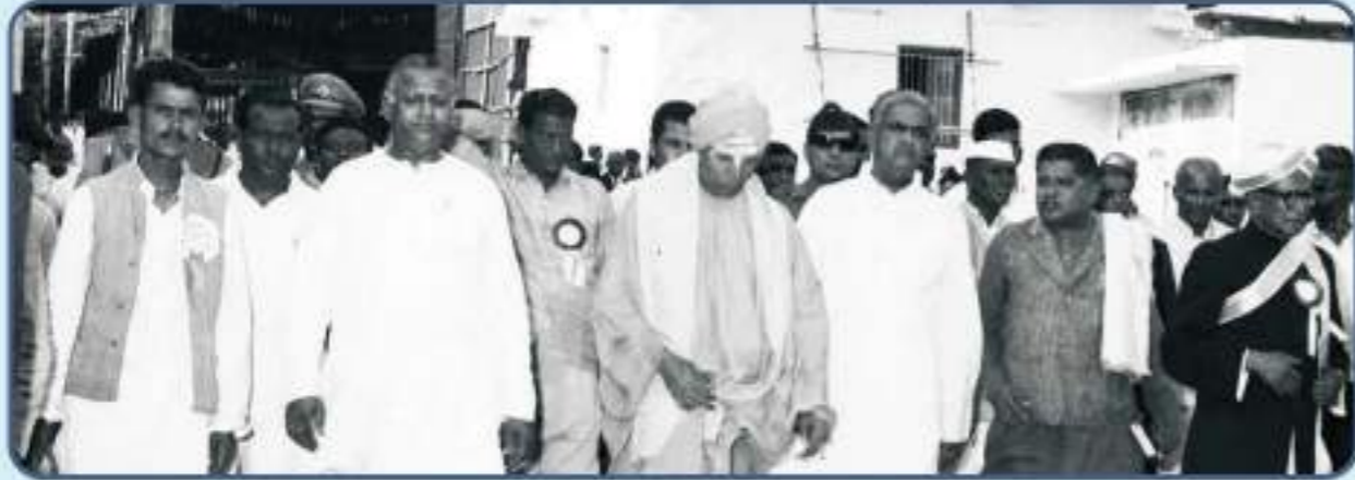
ಸ್ವಾಮೀಜಿ ಅವರೊಂದಿಗೆ ಮಠದ ಆವರಣದಲ್ಲಿ ಹೆಣ್ಣು ಜಾಕುತಿರುದ ಅಂದಿನ ಮುಖ್ಯಮಂತ್ರಿ ದೇವರಾಜ ಅರಸು ಜಾಗೂ ಅಂದಿನ ರಾಜ್ಯಪಾಲರಾದ ಬೋಪ್ಪಲಾಲ್ ಸುಮಾರಿಯಾ