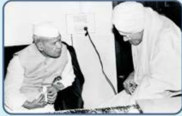
ದಿವಂಗತ ಮಾಜಿ ರಾಷ್ಟ್ರಪತಿ ಶಂಕರ್ ದಯಾಳ್ ಶರ್ಮಾ ಅವರು ಮಠಕ್ಕೆ ಭೇಟಿ ನೀಡಿದ ಸಂದರ್ಭ.