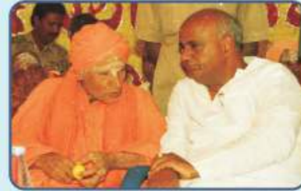
ಕಾರ್ಯಕ್ರಮವೊಂದರಲ್ಲಿ ಸ್ವಾಮೀಜಿ ಅವರೊಂದಿಗೆ ವೇದಿಕೆಯನ್ನು ಹಂಚಿಕೊಂಡಿದ್ದ ಅಂದಿನ ಮುಖ್ಯಮಂತ್ರಿ ಹೆಚ್.ಡಿ. ದೇವಗೌಡರು.