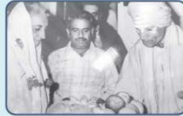
ಮಠಕ್ಕೆ ಆಗಮಿಸಿದ್ದ ಅಂದಿನ ಪ್ರಧಾನಮಂತ್ರಿ ತಿರಮತಿ ಇಂದಿರಾ ಗಾಂಧಿ ಅವರನ್ನು ಆತಿಥ್ಯವಹಿಸುತ್ತಿರುವ ಸ್ವಾಮೀಜಿ ಅವರು.