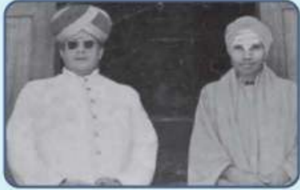
ಮೈಸೂರಿನ ಮಹಾರಾಜ ಜಯ ಚಾಮರಾಜ ಒಡೆಯರ್ ಮತ್ತು ಸ್ವಾಮೀಜಿ ಅವರು.