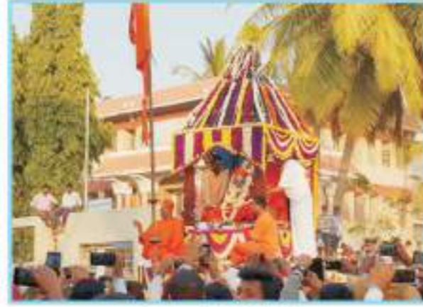
ಶ್ರೀಗಳ ಅಂಕಿತವು ಮೆರವಣಿಗೆಗೆ