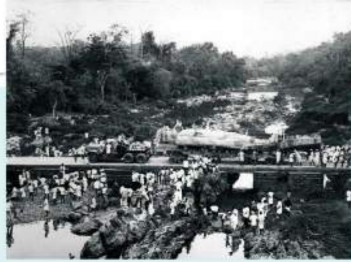
ತುಳು, ತೆಲುಗು, ಪ್ರಾಕೃತ, ತಮಿಳು, ಮರಾಠಿ, ಮಲಯಾಳಂ, ದೇವನಾಗರಿ ಭಾಷೆಗಳಲ್ಲಿ 5000 ಕ್ಕೂ ಮಿಕ್ಕಿದ ಹಸ್ತ ಪ್ರತಿಗಳ ಸಂಗ್ರಹವಿದೆ.

'ಕುಡುಮೆ'ವು ಧರ್ಮಸ್ಥಳವಾದದ್ದು ಶ್ರೀ ದೇವರಾಜ ಹೆಗ್ಗಡೆಯವರ ಕಾಲದಲ್ಲಿ ಅವರ ಆಡಳಿತದಲ್ಲಿ ಕ್ಷೇತ್ರಕ್ಕೆ ಆಗಮಿಸಿದ್ದ ಸೋದೆ ಮಠದ ಯತಿವರ್ಯರಾದ ವಾದಿರಾಜ ಗುರು ಸಾರ್ವಭೌಮರು ಕ್ರಿ.ಶ. 1550-1575 ಕಾಲಾವಧಿಯಲ್ಲಿ ಶ್ರೀ ಮಂಜೂನಾಥನ ಲಿಂಗಕ್ಕೆ ಅಷ್ಟಬಂಧ ಬ್ರಹ್ಮ ಕಲಕೋತ್ರವ ಸಹಿತ ಪ್ರತಿಷ್ಠಾ ನಡೆಸಿಕೊಟ್ಟು, ಈ ಸಂದರ್ಭದಲ್ಲಿ ನಡೆದ ದಾನ-ಧರ್ಮ ಸಮಾರಾಧನೆಗಳನ್ನು ಪ್ರತ್ಯಕ್ಷ ಕಂಡು ಸಂತುಷ್ಟರಾಗಿ ಇದು ಧರ್ಮಸ್ಥಳವೇ ಸರಿ ಎಂದು ಕರೆದರೆಂದು ಪ್ರತೀತಿಯಿದೆ.