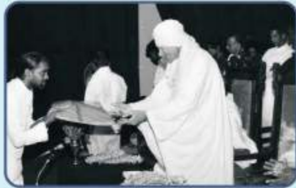
ಕಾರ್ಯಕ್ರಮವೊಂದರಲ್ಲಿ ಸ್ವಾಮೀಜಿ ಅವರು ಭಕ್ತರಿಗೆ ಸನ್ಮಾನಿಸುತ್ತಿರುವುದು.