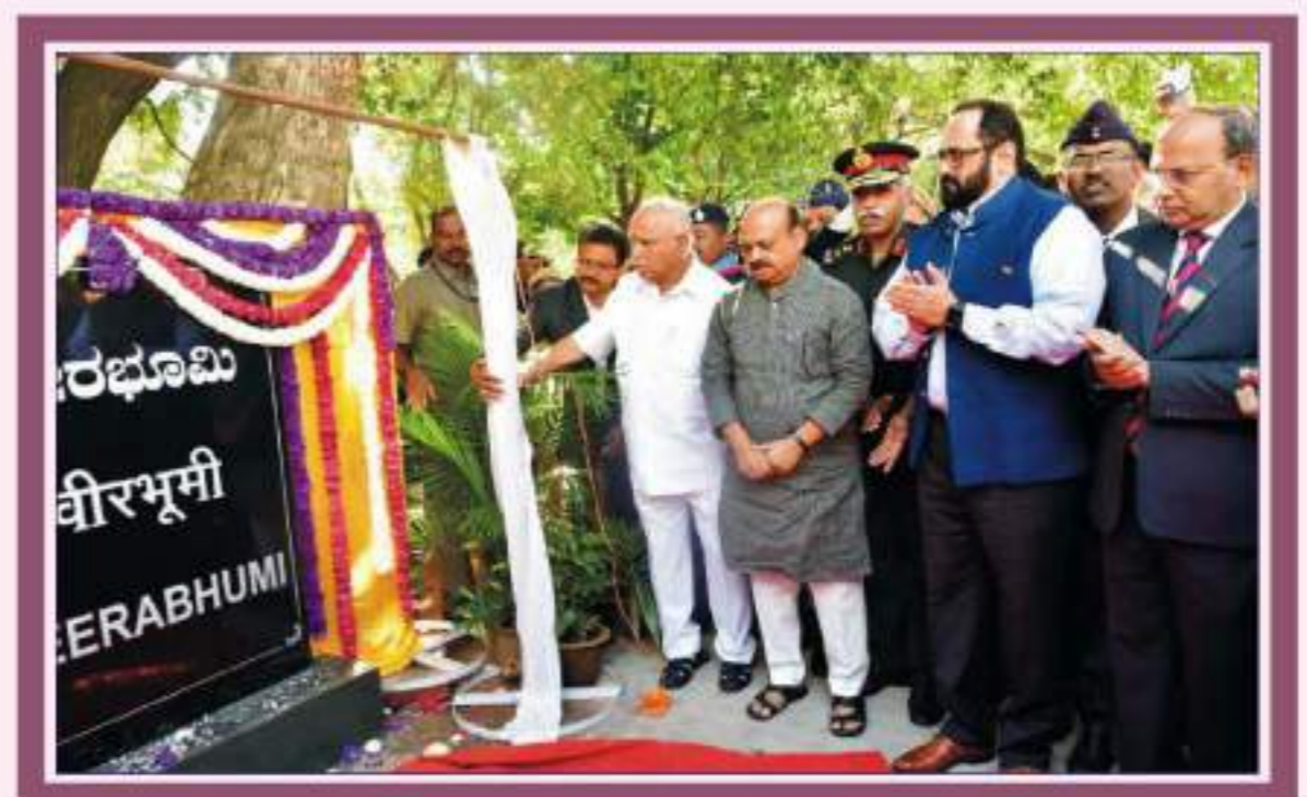
ಬೆಂಗಳೂರಿನ ರಾಷ್ಟ್ರೀಯ ಸೈನಿಕ ಸ್ಮಾರಕದಲ್ಲಿ ಡಿಸೆಂಬರ್ 16 ರಂದು ಆಯೋಜಿಸಿದ್ದ 48 ನೇ ವಿದಯ ದಿವಸದ ಸ್ಮರಣಾರ್ಥ ಸಮಾರಂಭದಲ್ಲಿ 'ವೀರಭೂಮಿ' ಶಿಲಾಫಲಕವನ್ನು ಮುಖ್ಯಮಂತ್ರಿ ಬಿ.ಎಸ್. ಯಡಿಯೂರಪ್ಪ ಅವರು ಅನಾವರಣಗೊಳಿಸಿದರು. ಗೃಹ ಸಚಿವರಾದ ಬಸವರಾಜ ಬೊಮ್ಮಾಯಿ, ರಾಜ್ಯಸಭಾ ಸದಸ್ಯರಾದ ರಾಜೀವ್ ಚಂದ್ರಶೇಖರ್ ಉಪಸ್ಥಿತರಿದ್ದಾರೆ.