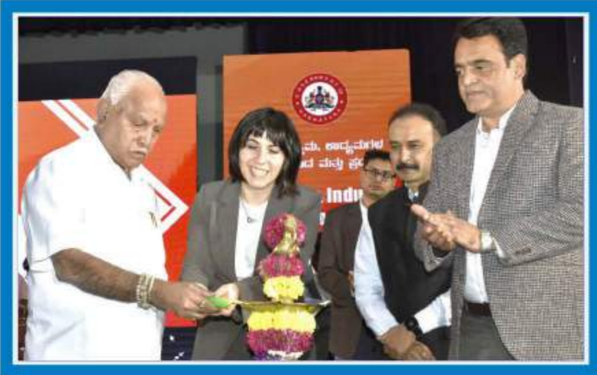
ಡಿಸೆಂಬರ್ 17 ರಂದು ಮಾಹಿತಿ ತಂತ್ರಜ್ಞಾನ, ಚೈನಿಕತಂತ್ರಜ್ಞಾನ, ವಿಜ್ಞಾನ ಮತ್ತು ತಂತ್ರಜ್ಞಾನ ಇಲಾಖೆಯ 100 ದಿನಗಳ ಸಂಭ್ರಮಾಚಾರಣೆಯ ಅಂಗವಾಗಿ ಏರ್ಪಡಿಸಲಾಗಿದ್ದ ಸಮೀಕ್ಷಣೀಯ ಉದ್ಯಮಿಗಳ ಜೊತೆ ಸಂವಾದ ಕಾರ್ಯಕ್ರಮವನ್ನು ಮುಖ್ಯಮಂತ್ರಿ ಬಿ.ಎಸ್.ಯಡಿಯೂರಪ್ಪ ಅವರು ಉದ್ಘಾಟಿಸುತ್ತಿರುವುದು. ಈ ಸಂದರ್ಭದಲ್ಲಿ ಉಪಮುಖ್ಯಮಂತ್ರಿಗಳು ಹಾಗೂ ಎಟಿ ಟಿ ವಿಜ್ಞಾನ ಮತ್ತು ತಂತ್ರಜ್ಞಾನ ಸಚಿವರಾದ ಡಾ.ಸಿ.ಎಸ್. ಅಶ್ವಥ್‌ನಾರಾಯಣ ಮತ್ತು ವಿದೇಶಿ ಗಣ್ಯ ಉದ್ಯಮಿಗಳು ಉಪಸ್ಥಿತರಿದ್ದರು.