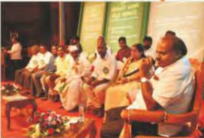
ಬೀದರ್‌ನಲ್ಲಿ ನಡೆದ 'ರೈತ ಸ್ವಂದನ'ದಲ್ಲಿ ಮುಖ್ಯಮಂತ್ರಿಗಳು

ಕಬ್ಬು ಬೆಳೆಗಾರರ ಸಮಸ್ಯೆ ಬಗೆಹರಿಸಿದ ಸರಕಾರ ಸಕ್ಕರೆ ಉತ್ಪಾದನೆಯಲ್ಲಿ ದೇಶದಲ್ಲೇ 3 ನೇ ಸ್ಥಾನದಲ್ಲಿರುವ ರಾಜ್ಯದಲ್ಲಿ ಸುಮಾರು 5.20 ಲಕ್ಷ ಹೆಕ್ಟೇರ್ ಪ್ರದೇಶದಲ್ಲಿ ವಾರ್ಷಿಕ ಅಂದಾಜು 409 ಲಕ್ಷ ಟನ್ ಕಬ್ಬು ಉತ್ಪಾದನೆಯಾಗುತ್ತಿದೆ. ಪ್ರಮುಖ ವಾಣಿಜ್ಯ ಬೆಳೆಯಾದ ಕಬ್ಬು ಒಂಬತ್ತು ಜಿಲ್ಲೆಗಳ ಲಕ್ಷಾಂತರ ಕುಟುಂಬಗಳ ನಿರ್ವಹಣೆಗೆ ಆರ್ಥಿಕ ಆಸರೆಯಾಗಿದೆ. ಸಕ್ಕರೆ ಬೆಲೆ ಕುಸಿತ ಮತ್ತಿತರ ಕಾರಣ ನೀಡಿ ಸಕ್ಕರೆ ಕಾರ್ಖಾನೆಗಳು ಸಮರ್ಪಕ ಬೆಲೆ ಕೊಡದೆ ಕೈಕೊಟ್ಟರೆ ಈ ರೈತ ಕುಟುಂಬಗಳ ಬದುಕು ಆತಂತ್ರ. ಪ್ರತಿ ವರ್ಷ ಕಬ್ಬು ಹಂಗಾಮು ಆರಂಭದಲ್ಲಿ ನಡೆಯುವ ಸಕ್ಕರೆ ಕಾರ್ಖಾನೆ ಮಾರ್ಲೀಕರು ಮತ್ತು ಕಬ್ಬು ಬೆಳೆಗಾರರ ನಡುವಿನ ಜಟಾಪಟ ಈ ಬಾರಿ ಇನ್ನಷ್ಟು ತೀವ್ರವಾಗಿಯೇ ಇತ್ತು. ನ್ಯಾಯಯುತ ಬೇಡಿಕೆ ಈಡೇರಿಕೆಗೆ ಸರಕಾರ ಮಧ್ಯ ಪ್ರವೇಶ ಮಾಡಬೇಕೆಂದು ಕೋರಿದ ಕಬ್ಬು ಬೆಳೆಗಾರರ ನೆರವಿಗೆ ಧಾವಿಸಿದ ಮುಖ್ಯಮಂತ್ರಿ ಎಚ್.ಡಿ.ಕುಮಾರಸ್ವಾಮಿ ನೇತೃತ್ವದ