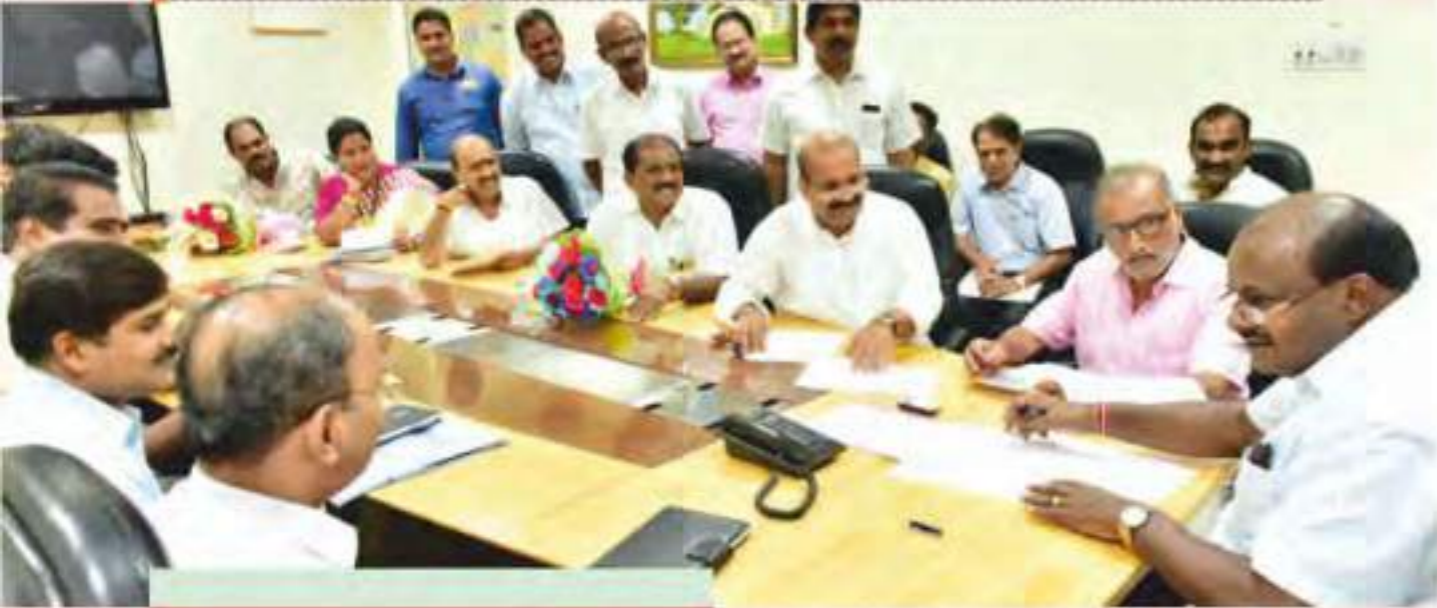
ಮೀನುಗಾರ ಸಂಘದ ಮುಖಂಡರು ಮತ್ತು ಪದಾಧಿಕಾರಿಗಳೊಂದಿಗೆ ಚರ್ಚೆ