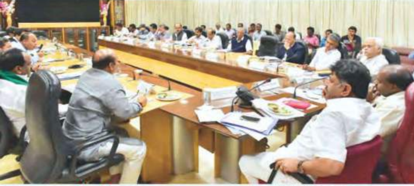
ಮಹದಾಯಿ ಯೋಜನೆ ಬಗ್ಗೆ ದೀರೋಧ ಪಕ್ಷಗಳು, ನೀರಾವರಿ ತಜ್ಞರು ಮತ್ತು ರೈತರೊಂದಿಗೆ ಚರ್ಚೆ