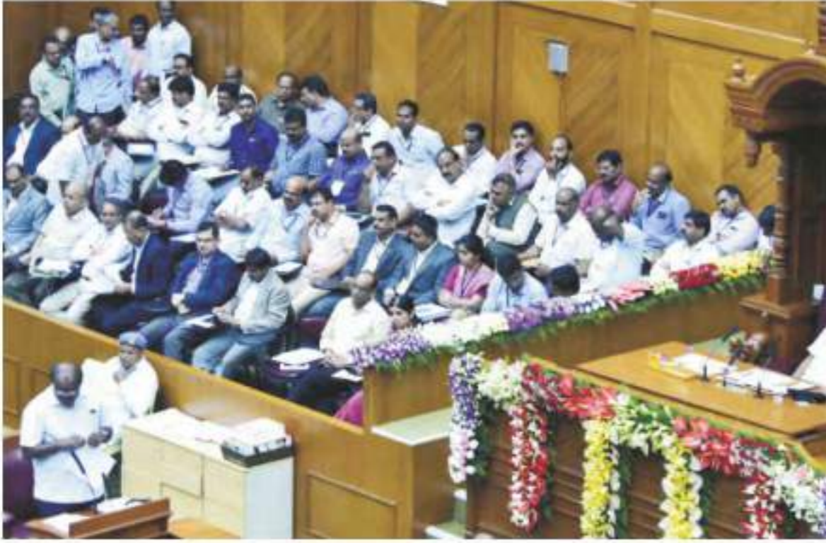
ಬೆಳಗಾವಿಯಲ್ಲಿ ಜರುಗಿದ ಅಧಿವೇಶನದ ಮೊದಲ ದಿನದಂದು ವಿಧಾನಸಭೆಯಲ್ಲಿ ಮುಖ್ಯಮಂತ್ರಿ ಎಚ್.ಡಿ.ಕುಮಾರಸ್ವಾಮಿ ಅವರು ಆಗಲಿದ ಗಣ್ಯರಿಗೆ ಸಂತಾಪ ಸೂಚಿಸುತ್ತಿರುವುದು.