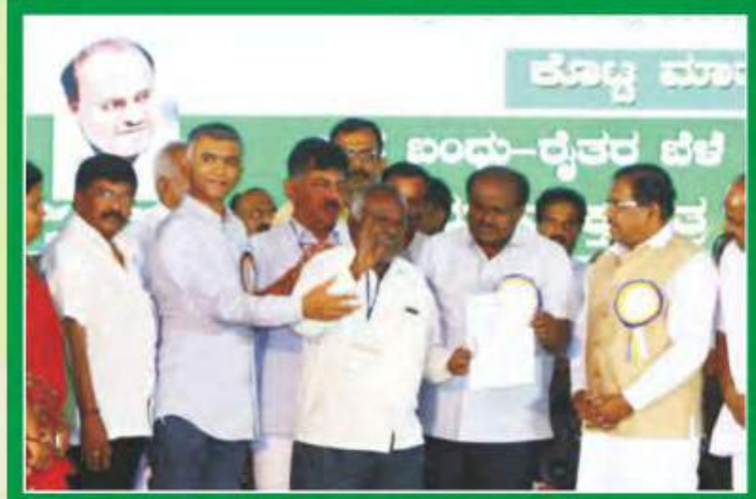
'ರೈತ ಬಂಧು': ಬೆಳೆ ಸಾಲಮನ್ನಾ ಯೋಜನೆಯಡಿ ಬೋನು ಮುಕ್ತ ಪತ್ರವನ್ನು ರೈತರಿಗೆ ವಿತರಿಸಿದ ಮುಖ್ಯ ಮಂತ್ರಿ ಹೆಚ್.ಡಿ.ಕುಮಾರಸ್ವಾಮಿ.

ಸಹಕಾರ ಸಂಘಗಳಲ್ಲಿನ ಲಕ್ಷ ರೂ. ವರೆಗಿನ ಮನ್ನಾ ತೀರ್ಮಾನದಿಂದ ಈ ಸಂಘಗಳಲ್ಲಿನ ರೈತರ ಒಟ್ಟು 10,734 ಕೋಟಿ ರೂ. ಸಾಲದ ವೈಕಿ 9,448.61 ಕೋಟಿ ರೂ. ಮನ್ನಾ ಆಗಿದ್ದು, ಸಾಲ ಪಡೆದಿರುವ 22 ಲಕ್ಷ ರೈತರ ವೈಕಿ 20.38 ಲಕ್ಷ ರೈತರಿಗೆ ಈ ತೀರ್ಮಾನದಿಂದ ಲಾಭವಾಗಿದೆ. ವಾಣಿಜ್ಯ ಬ್ಯಾಂಕ್ ಗಳಲ್ಲಿನ 2 ಲಕ್ಷ ರೂ. ವರೆಗಿನ ಬೆಳೆ ಸಾಲ ಮನ್ನಾ ತೀರ್ಮಾನದಂತೆ ಒಟ್ಟು 23.71 ಲಕ್ಷ ರೈತರ ಸಾಲದ ವಾತೆಗಳಲ್ಲಿನ 22,545 ಕೋಟಿ ರೂ. ಸಾಲ ಮನ್ನಾ ಆಗುತ್ತಿದೆ. ಜತೆಗೆ, ಗ್ರಾಮೀಣ ಬ್ಯಾಂಕ್‌ಗಳ ಸಾಲ ಮನ್ನಾ ಆಗಿದೆ. ಇದರೊಂದಿಗೆ, ಸಹಸ್ರಾರು ರೈತ ಕುಟುಂಬಗಳು ಸಾಲದ ಶೂಲದಿಂದ ಮುಕ್ತಿ ಪಡೆಯುತ್ತಿವೆ. ಈ ಯೋಜನೆಯಿಂದ ರಾಜ್ಯದ ದೊಕ್ಕಸಕ್ಕೆ 45 ಸಾವಿರ ಕೋಟಿ ರೂ. ಹೊರೆಯನ್ನು ಅಂದಾಜು ಮಾಡಲಾಗಿದೆ.