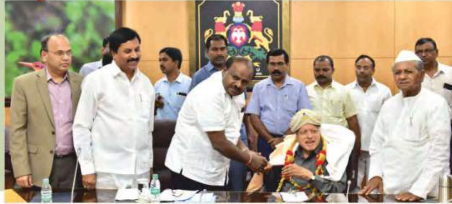
ಕೃಷಿ ತಜ್ಞ ಡಾ. ಸ್ವಾಮಿನಾಥನ್ ಅವರಿಗೆ ಅಭಿನಂದನೆ

ರೈತರಲ್ಲಿ ವಿಶ್ವಾಸ ಮೂಡಿಸಿ, ಒತ್ತಾಸೆಯಾಗಿ ನಿಂತು ಕೃಷಿ ವಲಯದಲ್ಲಿ ಸುಸ್ಥಿರ ಅಭಿವೃದ್ಧಿಗೆ ಅಗತ್ಯ ವಾತಾವರಣ ನಿರ್ಮಾಣ ಮಾಡುವ ನಿಟ್ಟಿನಲ್ಲಿ ವಿನೂತನ ಕೃಷಿ ಪ್ರಯತ್ನಗಳು ಆರಂಭವಾಗಿದೆ. "ಇಸ್ರೇಲ್ ಮಾದರಿ ಕೃಷಿ ಪದ್ಧತಿ" ಹಾಗೂ "ತೂನ್ಯ ಬಂಡವಾಳ ಕೃಷಿ" ಇಂತಹ ಪ್ರಯತ್ನಗಳಲ್ಲಿ ಪ್ರಮುಖವಾದವು.