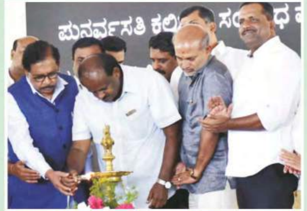
ಸೋಮವಾರವೇಟೆ ತಾಲೂಕಿನ ಜಂಬೂರು ಗ್ರಾಮದಲ್ಲಿ ಪ್ರಕೃತಿ ವಿಕೋಪದಲ್ಲಿ ಮನೆ ಕಳೆದುಕೊಂಡಿರುವ ಸಂತ್ರಸ್ತರಿಗೆ ಪುನರ್ವಸತಿ ಕಲ್ಪಿಸುವ ನಿಟ್ಟಿನಲ್ಲಿ ಮನೆ ನಿರ್ಮಾಣಕ್ಕೆ ಮುಖ್ಯಮಂತ್ರಿ ಎಚ್.ಡಿ.ಕುಮಾರಸ್ವಾಮಿ ಅವರು ತಂಕುಸ್ಥಾಪನೆ ನೆರವೇರಿಸಿದರು. ಈ ಸಂದರ್ಭದಲ್ಲಿ ಉಪಮುಖ್ಯಮಂತ್ರಿ ಡಾ.ಬಿ.ಪರಮೇಶ್ವರ್, ಸಚಿವರಾದ ಸಾ.ರಾ.ಮಹೇಶ್, ಯು.ಟಿ.ಖಾದರ್, ಸೇರಿದಂತೆ ಮತ್ತಿತರ ಗಣ್ಯರು ಉಪಸ್ಥಿತರಿದ್ದಾರೆ.