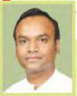
ಪ್ರಯಾಂಕ ಬಿರ್ಗಿ ಸಮಾಜಕಲ್ಯಾಣ ಸಚಿವರು

ದುರ್ಬಲ ಸಮುದಾಯಕ್ಕೆ ಅನುಕೂಲವಾಗುವಂತೆ ತಂತ್ರಜ್ಞಾನ ಕ್ಷೇತ್ರದಲ್ಲಿ ಉದ್ಯಮತೀಲತೆ, ಆರ್ಥಿಕ ಸಬಲತೆ ಮತ್ತು ಕೌಶಲ ಅಭಿವೃದ್ಧಿಗಾಗಿ ಸಮಾಜ ಕಲ್ಯಾಣ ಇಲಾಖೆ 'ಉನ್ನತಿ' ಎಂಬ ವಿನೂತನ ಯೋಜನೆ ಆರಂಭಿಸಿದೆ. ಈ ಯೋಜನೆಯಡಿ ಪರಿಶಿಷ್ಟ ಜಾತಿ ಹಾಗೂ ವರ್ಗಗಳ ಉದ್ಯಮಿಗಳಿಗೆ ನವೋದ್ಯಮಗಳನ್ನು ಸ್ಥಾಪಿಸಲು ಆರಂಭಿಕ ಅಗತ್ಯತೆ ಪೂರೈಸುವ ಪರಿಕಲ್ಪನೆ ಇದಾಗಿದ್ದು, ಉದ್ಯಮಿಗೆ ಗರಿಷ್ಠ ರೂ 50 ಲಕ್ಷವರೆಗೂ ಆರ್ಥಿಕ ನೆರವು ನೀಡಲಾಗುತ್ತಿದೆ.