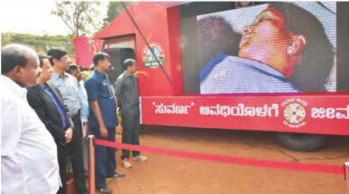
ರಸ್ತೆ ಅಪಘಾತ ಪ್ರಮಾಣ ತಗ್ಗಿಸುವ ಉದ್ದೇಶದಿಂದ ವಿಶ್ವಬ್ಯಾಂಕ್‌ನ ನೆರವಿನೊಂದಿಗೆ ಆರಂಭಿಸಲಾಗಿರುವ ರಸ್ತೆ ಸುರಕ್ಷತಾ ಅಭಿಯಾನವನ್ನು ಪ್ರಯೋಗಿಕವಾಗಿ ಬೆಳಗಾವಿಯಲ್ಲಿ ಚಾಲನೆ ನೀಡಿದ ಮುಖ್ಯಮಂತ್ರಿ ಅವರು ಅಪಘಾತವಾದ ಸಂದರ್ಭದಲ್ಲಿ ಕೈಗೊಳ್ಳಬೇಕಿರುವ ಕ್ರಮಗಳನ್ನು ತಿಳಿಸುವ ಕಿರುಚಿತ್ರವನ್ನು ವೀಕ್ಷಿಸುತ್ತಿರುವುದು.