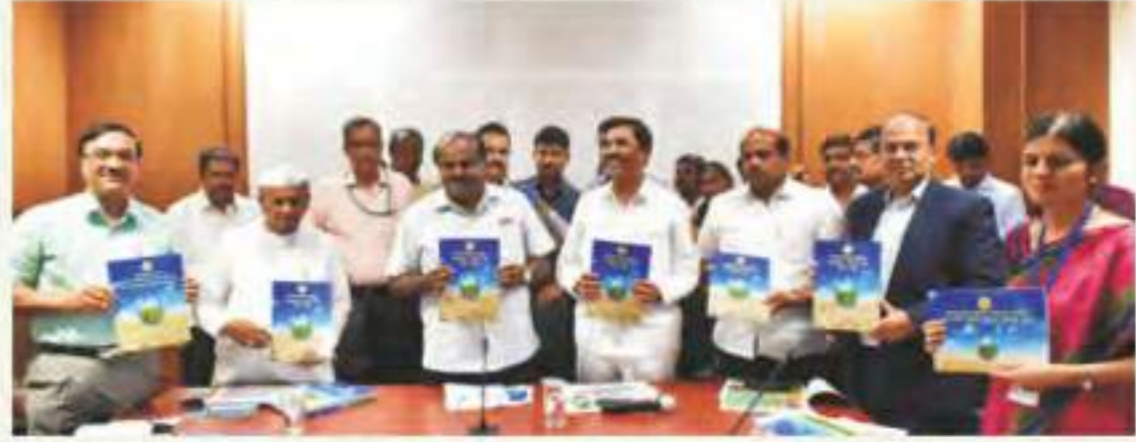
ಇಸ್ರೇಲ್ ಮಾದರಿ ಕೃಷಿ ಕುರಿತು ರಚಿಸಲಾದ ಉನ್ನತ ಮಟ್ಟದ ಅಧ್ಯಯನ ಸಮಿತಿಯ ತನ್ನ ವರದಿಯನ್ನು ಮುಖ್ಯಮಂತ್ರಿಗಳಿಗೆ ಸಲ್ಲಿಸಿತು.